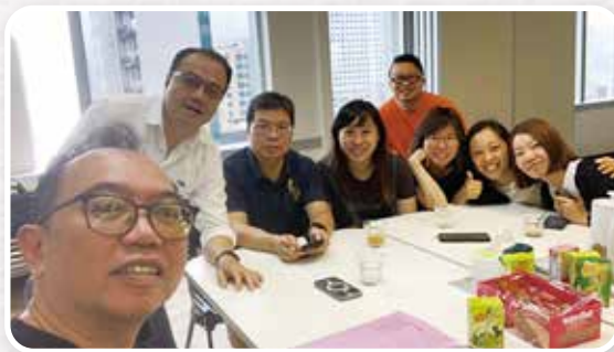
▲ 教關油尖旺牧者網絡核心小組

現時教關油尖旺區網絡嘗試在區內推動「共同牧養」，鼓勵教會以社區為中心，視為「一個牧養」場景，由不同堂會的牧者按街坊需要回應，並且彼此協作更好地運用資源增加社區資產。教關油尖旺區網絡已在社區建立了穩固的資源網絡，專業團契、教會、餐廳、業主、果欄商戶、酒店等持份者都參與其中。期後亦成立「核心小組」，推動牧者間彼此守望關顧，亦關注「油麻地旺角社區重建」，促進教會間更靈活地即時回應社區需要，持續轉化社區。如2025年的油麻地廣東道家庭慘劇，牧者可即時回應成為社區的安全網，為受影響的家庭和鄰舍提供協助，將慘劇轉化成凝聚社區力量的契機。