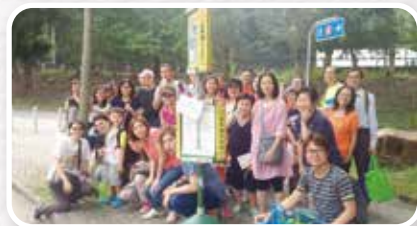
▲教關首次與伙伴到水泉澳禱告