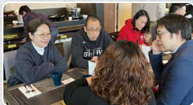
▲ 牧者領袖早餐及祈禱會 # 促進跨堂會協作 # 創造經驗交流空間