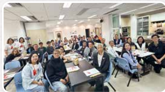
▲ 北區感恩午餐暨交流會