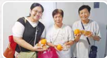
▲ 重建長者自信，長者從被探訪，轉化為義工，探訪鄰舍，回饋社區