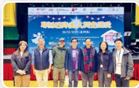
▲油尖旺區聯堂聖誕嘉年華