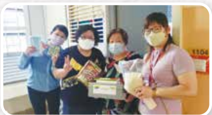
▲探訪關懷居民，派發緊急防疫物資檢測包及 PeaceBox