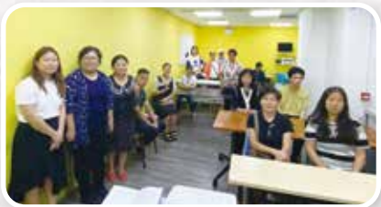
▲「泉心護你義工隊」組長培訓