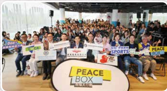
▲ PeaceBox 祝福大行動 2025 開幕禮 # 推動全城關懷貧窮 # 建立關愛鄰舍天國