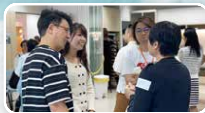
▲ 教關北部都會區交流會