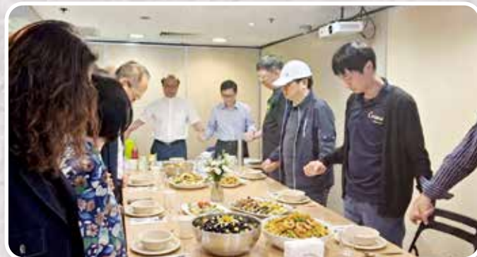
▲ 牧者網絡顧問會議 # 識別各區服務空隙 # 收集實證數據轉化社區