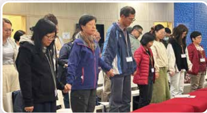
▲ 牧者領袖退修日 # 營造牧者同行文化 # 推動合一服侍