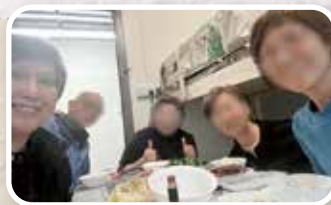
▲ 宣道會大埔堂牧者（左一）與信徒一同探訪遷到過渡性房屋的宏福苑居民，並將教關「宏福苑火災支援基金——一杯涼水緊急援助金」轉交予居民。