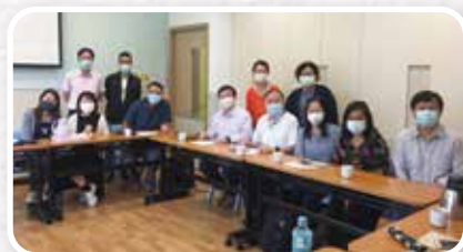
▲四間核心堂會協作商討服侍居民