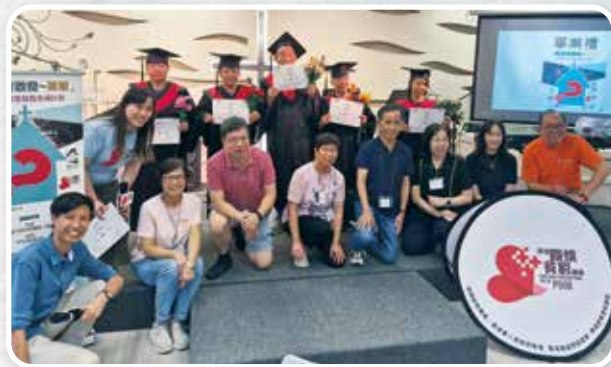
▲「教關跨堂會基層啟發先導計劃—「同區齊啟發」畢業禮

12 月 26 日 同區聯堂聖誕活動， 連續 4 年連結教會、機構、專業人士及職場團契協作 ，祝福基層人士。