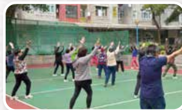
▲ 天平邨跨堂會讚美操

「北部都會區學校協作分享會」，超過 20 個單位、50 人出席，隨即成立「教關北區學習支援小組」，聯繫 5 間教會及多位教育同工，專注服侍北區基層學生及跨境學童