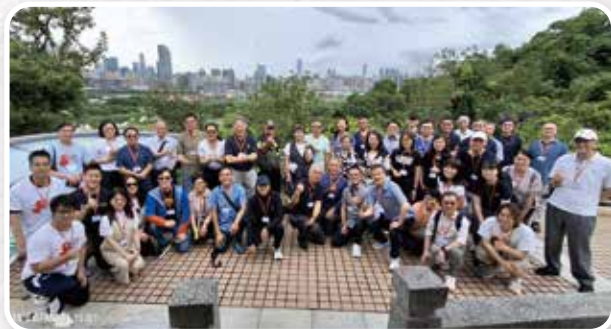
▲ 「北都呼聲」異象考察之旅職場版