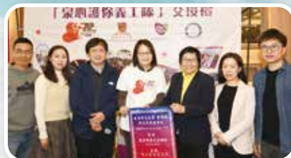
▲「泉心護你義工隊」交接禮