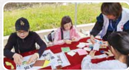
▲ 水泉澳居民於聖誕嘉年華為宏福苑居民撰寫福卡